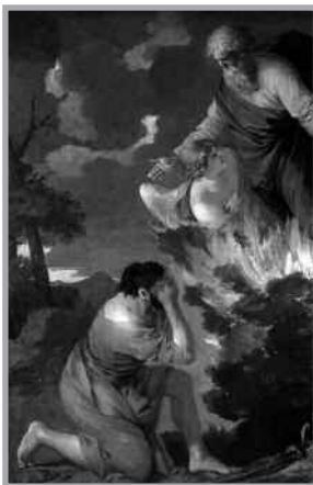
La teofanía de Dios a Moisés en la zarza ardiendo en el Sinaí

También es interesante observar que, si Moisés en un principio se cubría la cara para hablar con el Señor, aquí ya era al revés: se descubría el rostro y se lo cubría con el velo justamente después, cuando iba a transmitir a los hombres lo que Él le había dicho y revelado (Ex 34,29-35). Tal era la intimidad que había alcanzado ante Dios. ■