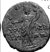
Moneda de Herodes Agripa II (27-92)

El discurso ante el rey Agripa II es uno de los más personales de Pablo, y representa el desenlace de su actividad misionera.