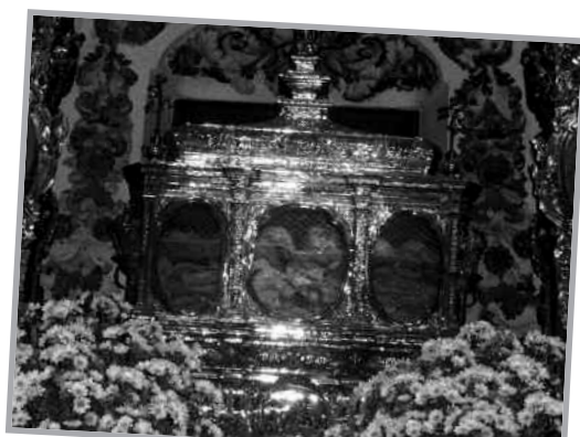
Arca con las reliquias de los mártires en la Basílica de San Pedro, en Córdoba.

Por su lado Servideo (es decir, Servidor de Dios) era un joven monje, que se había formado junto con Gumersindo, y vivía ahora como recluso en el santuario mencionado. Un día —san Eulogio no es más específico con las circunstancias— bajaron juntos a la ciudad, fueron señalados como cristianos, y allí mismo fueron decapitados. Sus restos fueron sustraídos por los cristianos, y escondidos en la iglesia de San Cristóbal, para poder perpetuar la veneración por ellos. El médico y erudito cordobés Dr. Ángel Fernández Dueñas, afirma que es posible que los restos perdidos de estos mártires estén en la urna común que se conserva en Córdoba, y que tuvo la oportunidad de estudiar personalmente. ■