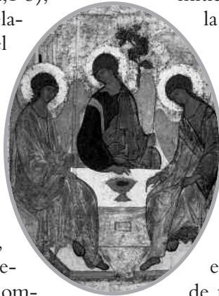
Teofanía de Mambré Andrei Rublev, siglo XV

va entrando en una relación profunda con el Señor, que es normalmente quien toma la iniciativa revelándose y dándole instrucciones. Pero hay un momento precioso: la teofanía de Mambré, donde Dios se le aparece en forma de tres hombres y él habla con ellos (Gn 18,1-16). La tradición cristiana de Oriente y de Occidente ha entendido siempre este encuentro junto a la encina de Mambré como una teofanía trinitaria, una revelación de las tres divinas personas, con quienes