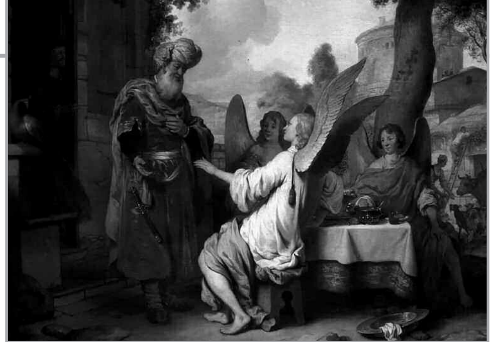
“Abraham y los tres ángeles” Gerbrand Van den Eeckhout, 1656. Museo del Hermitage, San Petersburgo (Rusia)

A continuación del pasaje comentado, hay un ejemplo magnífico de oración de intercesión: