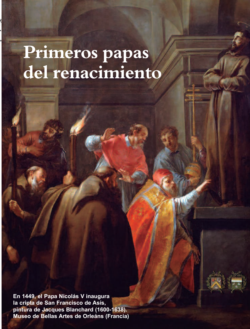
En 1449, el Papa Nicolás V inaugura la cripta de San Francisco de Asís, pintura de Jacques Blanchard (1600-1638). Museo de Bellas Artes de Orleáns (Francia)

Como Papas del renacimiento suelen considerarse principalmente Nicolás V y Pío II, y juntamente todos los que les siguieron hasta principios del siglo XVI.