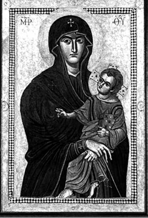
Nuestra Señora de la Nieves o Salus Populi Romani