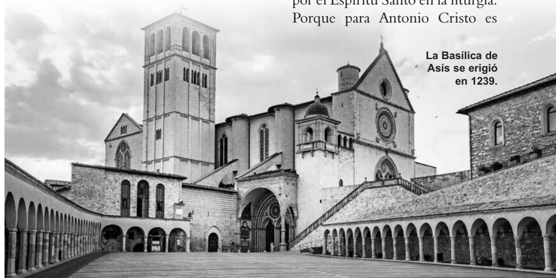
La Basílica de Asís se erigió en 1239.

pilares, bóvedas de crucería con sus nervios firmes, junto con las vidrieras, son el símbolo de la teología que hallamos en los Sermones de Antonio. En ellos no desea otra cosa que elevar templos vivos a Dios, como racimo gótico de agujas vivientes en el cuerpo de la Iglesia. Como cimiento firme del edificio coloca la Escritura, sobre la que se alzan las piedras sillares de los fieles, edificados en la liturgia y en la sabiduría patristica. Las ojivas, vidrieras y agujas, que dan color y esbeltez al edificio son el amor de Dios, manifestado en Cristo y difundido en la Iglesia por el Espíritu Santo en la liturgia. Porque para Antonio Cristo es