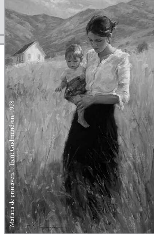
“Mañana de primavera”, Trent Gudmundsen, 1978

A la luz de todo esto podemos preguntarnos: ¿yo siembro el bien? ¿Me preocupo solo por recoger para mí o también de sembrar para los otros? ¿Lanzo algunas semillas del Evangelio en la vi-