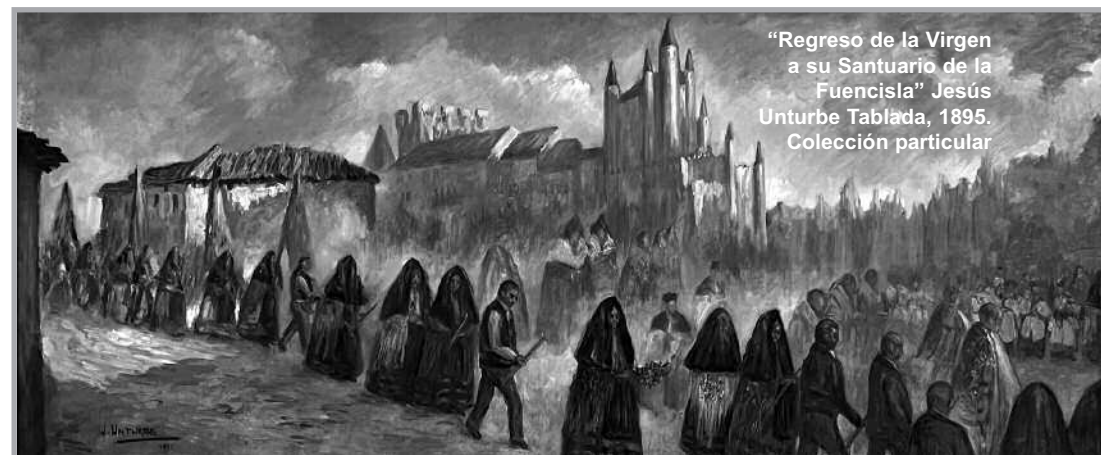
"Regreso de la Virgen a su Santuario de la Fuencisla" Jesús Unturbe Tablada, 1895. Colección particular