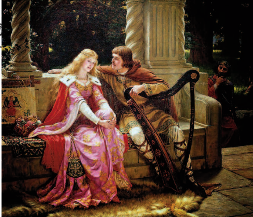
“El final de la canción - Tristan e Isolda” Edmund Blair Leighton, 1902. Colección particular