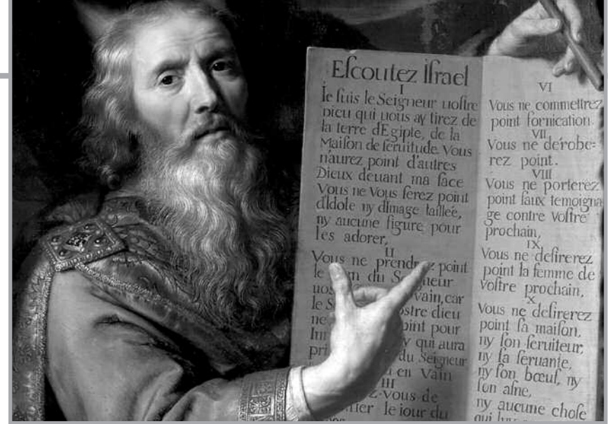
“Moisés presentando las Tablas de la Ley”, ca. 1648. Philippe de Champaigne (1602-1674). Colección particular

Fiel a las Escrituras y de acuerdo con el ejemplo de Jesús que, con sus acciones y predicación, atestiguó su valor. Los Padres de la Iglesia han convertido