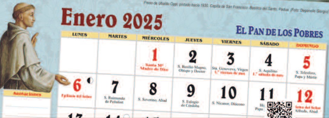
Fresco de Ubaldo Oppi, pintado hacia 1930. Capilla de San Francisco, Basilica del Santo, Padua