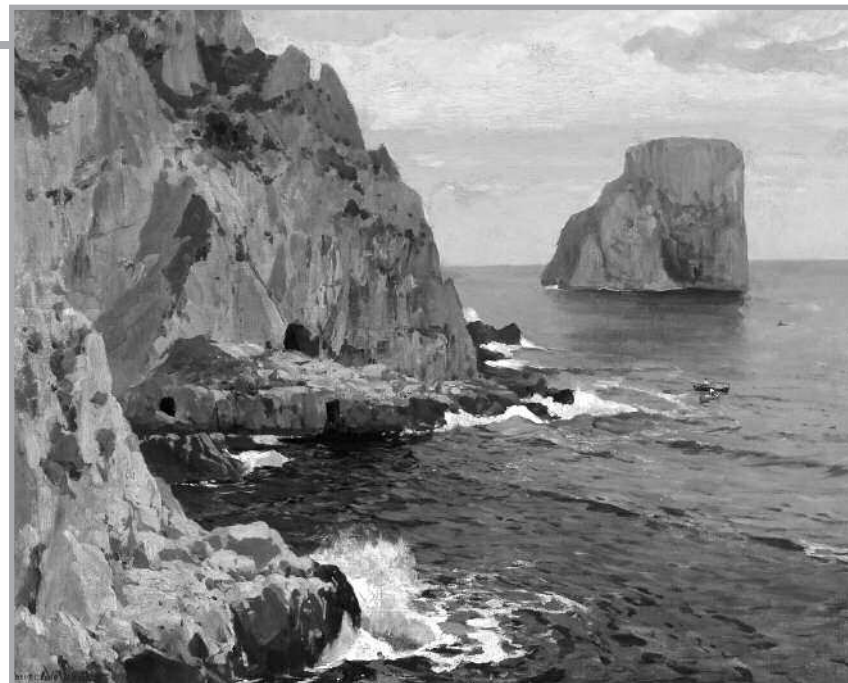
“Costa de Capri”. Manuel Wieldand, 1897. Colección particular.

Sanguíneo - flemático: Normalmente tiene buen humor y tienden a buscar el lado positivo a todas las situaciones. Les gusta ayudar a las personas. Se mueven más